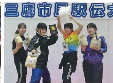
目標のお米をゲット「OKOMEリターンズ」