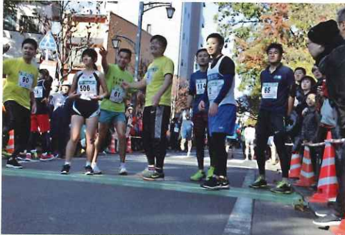
山本記念館前で、第2走者をまつ第3走者