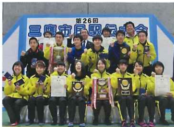
姉妹市町の招待チーム「矢吹町」