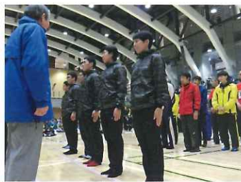
一般男子優勝の「三鷹警察署」