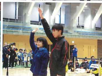
中学生の選手宣誓(三鷹6中)