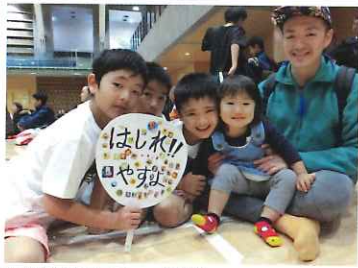
手描きのウチワでママを応援