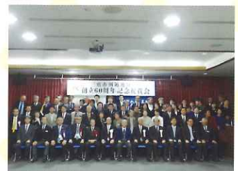
三鷹産業プラザ7階