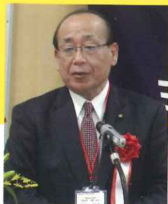
三鷹市議会議長 宍戸治重