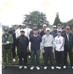
姉妹市町矢吹町町民ゴルフ大会

体協加盟団体の皆様、お待たせしました。グラウンド夜間照明の設備使用が始まりました。 ● 野球場(B面) ● サッカー兼ラグビー場 ● テニスコート(1月27日より) ● 多目的スポーツ広場(2月3日より)