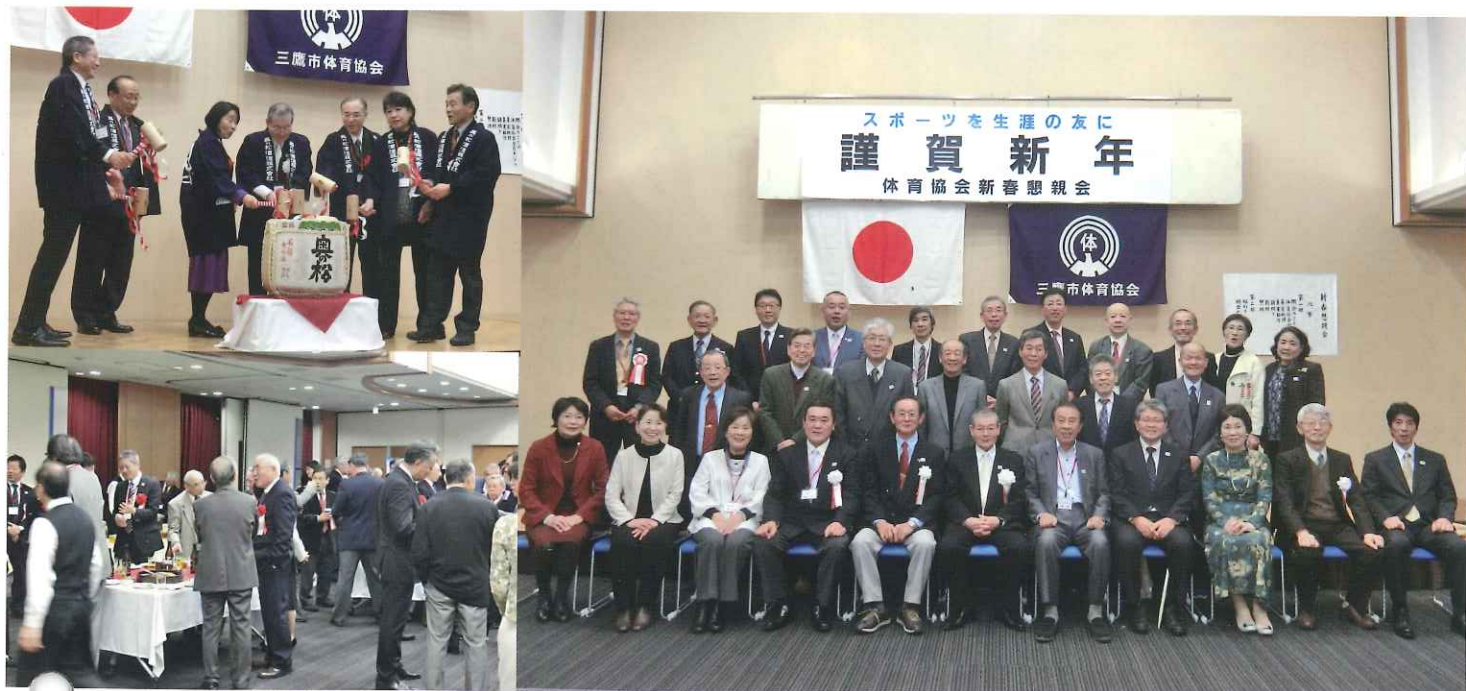
三鷹市体育協会新春懇親会 1月18日(日)、三鷹産業プラザで盛大に開催された。来賓の清原慶子三鷹市長を始め、行政関係者、体協加盟団体代表者等合計130名の方々が会場を埋めた。