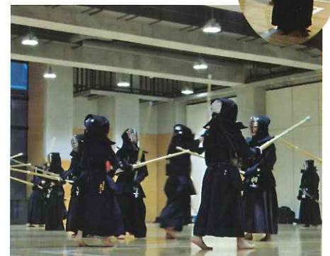
SUBARU総合スポーツセンター 武道場