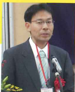
東京都議会議員 中村ひろし