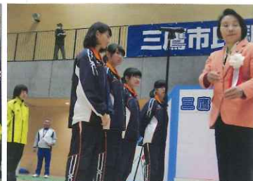
一般女子優勝の「法政高校陸上部女子」