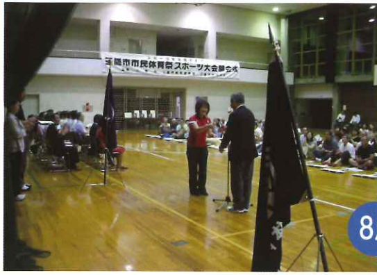
市民体育祭スポーツ大会(開会式)