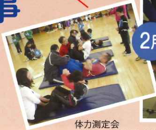
体力測定会 スポーツ指導員養成講習会・研修会