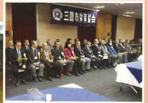
体協新春懇親会 スポーツ推進委員協議会との 理事交流会