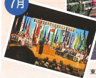
東京都市町村総合体育大会(開会式)