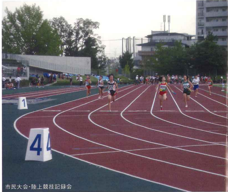
市民大会・陸上競技記録会